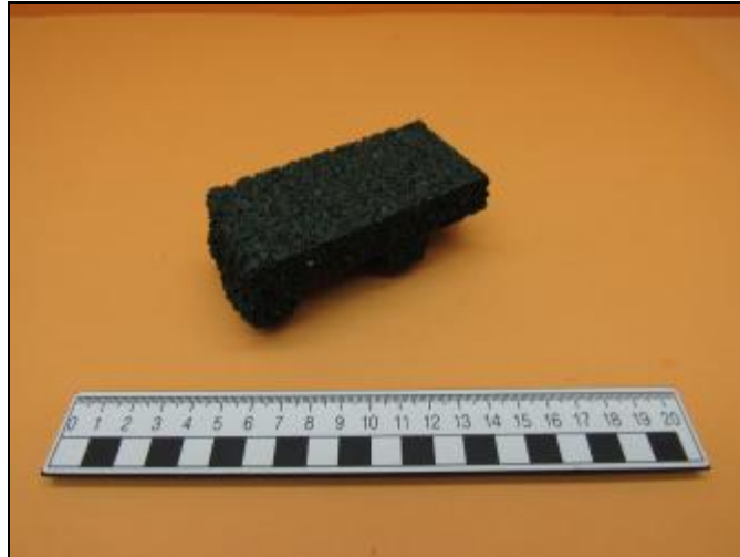
Nº 1: Muestra color verde 150x50x40